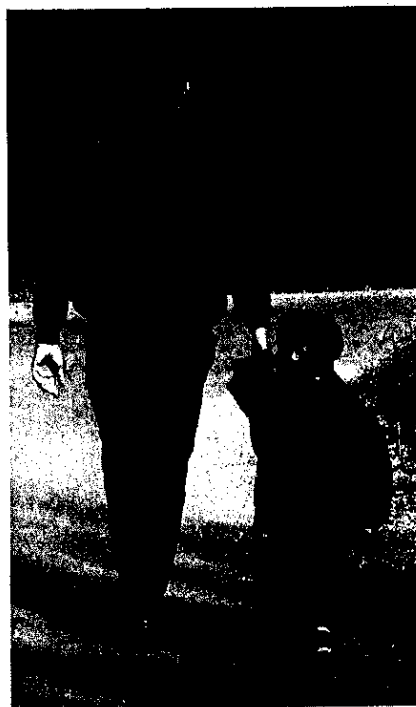
Direkte Demokratie - ein Modell mit Zukunft!

100 000 Unterschriften reichen aus. Besser viermal im Jahr abstimmen als vier Jahre lang zuschauen!