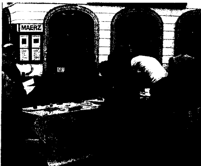
Unterschreiben Sie direkt an einem Stand mit Notar... ...oder auf Ihrem Gemeindeamt!

Wir Bürger müssen die Möglichkeit bekommen, durch Volksbegehren und Volksabstimmung einzugreifen und punktuell politische Entscheidungen